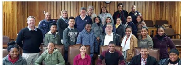
Die nuwe groep van 12 studente in die Burgemeester se Bevordering van Jeug-program saam met verskeie munisipale amptenare, wat ook as mentors vir die studente sal dien.

Hoewel die hoof feesterrein by die Ou Kragstasie by Santos ingerig was, het meer as 30 restuarante in en om Mosselbaai ook eksklusiewe aanbiedings vir die duur van die fees aangebied. 'n Gratis vervoerdiens is aan feesgangers beskikbaar gestel om van en na die verskillende restuarante te pendel.